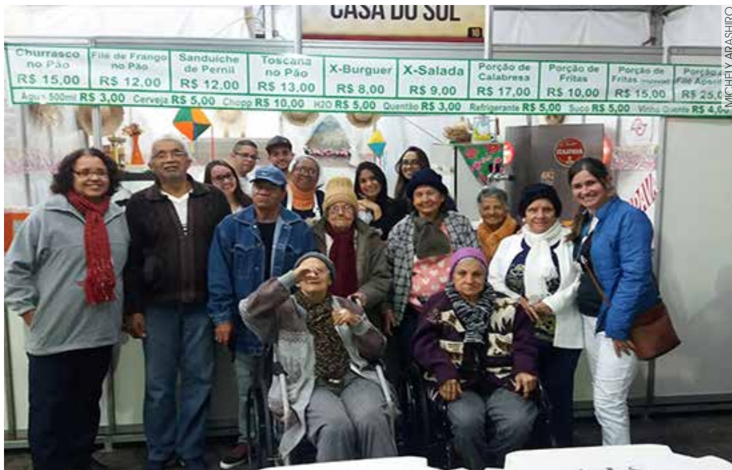
Moradores, voluntários e funcionários do Residencial Casa do Sol posando para a foto em frente a barraca

Ocupando a barraca de número 10, o antigo Asylo de Inválidos de Santos celebrou a festa servindo a todos deliciosos lanches preparados pelo nosso cozinheiro Guilherme e contou com a ajuda das Lojas Maçônicas Fraternidade de Santos e Amigos da Verdade. O 55º Grupo Escoteiro Morvan Dias Figueiredo também marcou presença, juntamente com voluntários e colaboradores da Instituição, ajudando a