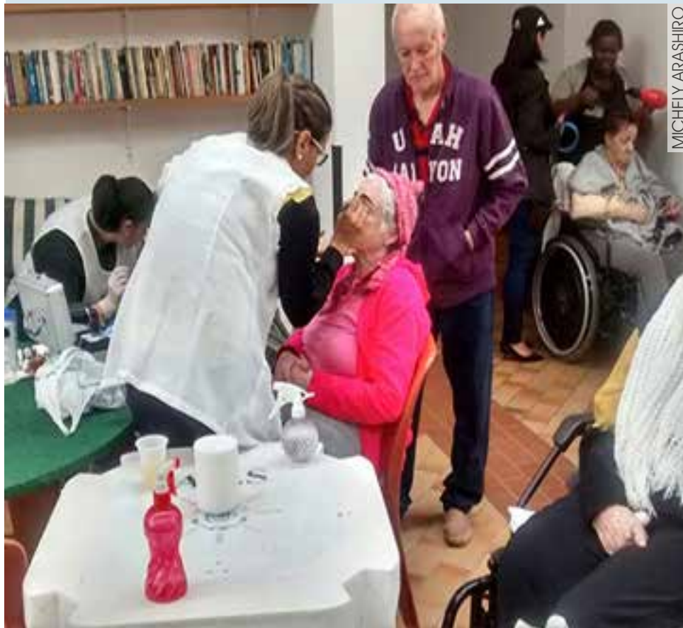
Apresentação de coral, com música tocada ao vivo, para os moradores

Como o evento teve início às 8h da manhã e só foi terminar às 17h, naquele sábado, nossos moradores se distraíram completamente até a janta, apreciando e aproveitando essa, até então, novidade de dinâmica no Residencial Casa do Sol.