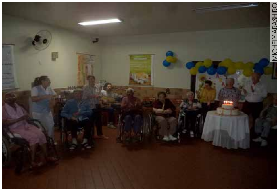
Moradores, funcionários, convidados e visitantes reunidos para o parabéns