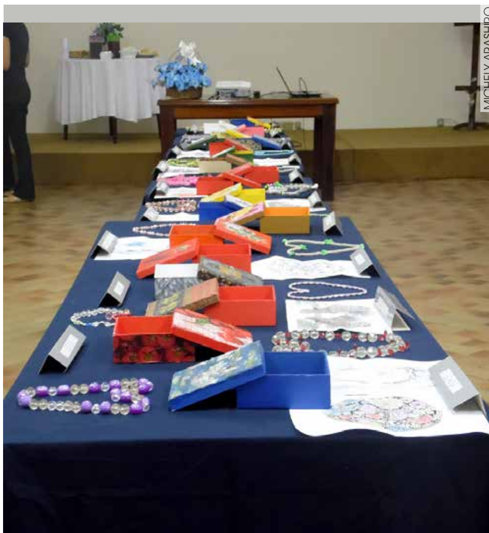
Exposição das caixinhas e acessórios confeccionados pelos moradores

No dia 29 de setembro, o grupo Eduardo Furkini marcou presença com a Contação de Histórias especial preparada somente para a Semana do Idoso, com diversas histórias de caráter reflexivo.