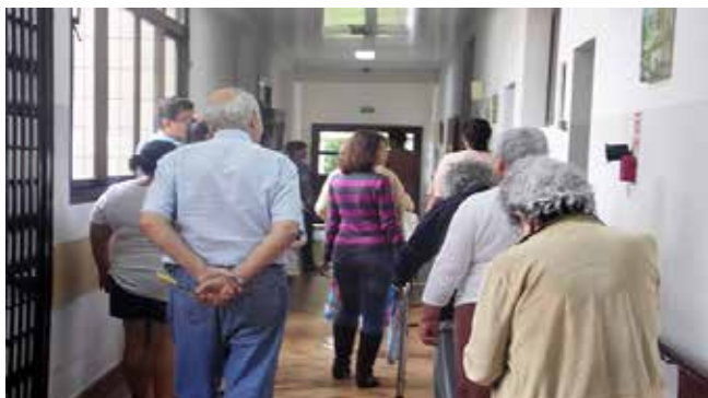
Moradores acompanhando a equipe do CRAS São Bento na visita pelo Residencial Casa do Sol