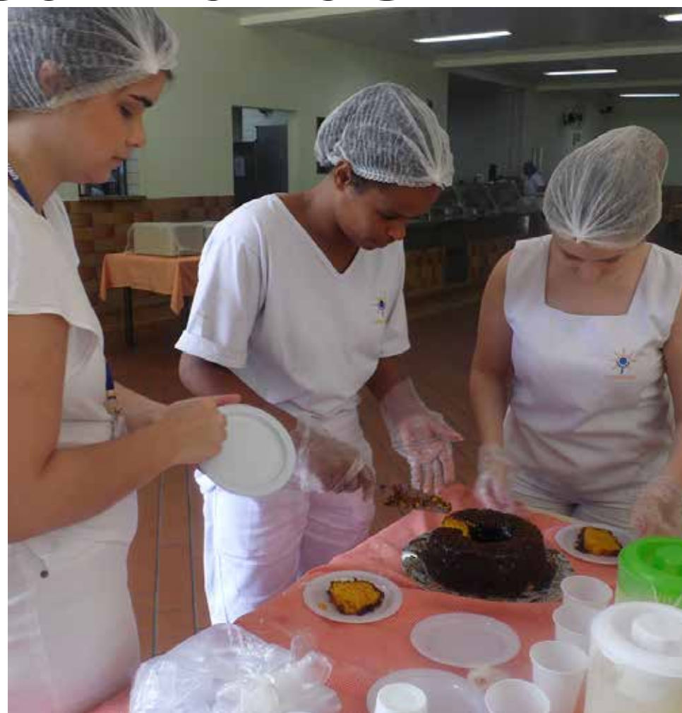
Após apresentar a receita, é hora de cortar e servir o delicioso bolo