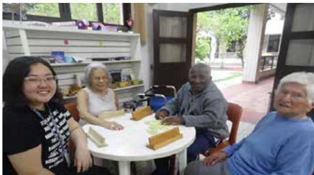
Registro de uma das tardes de jogos de dominó com os jogadores mais frequentes