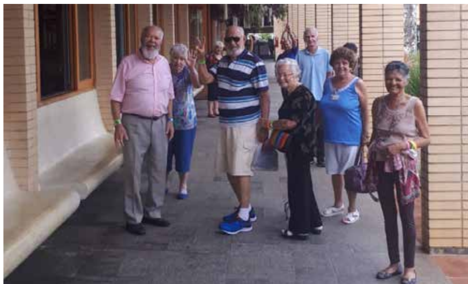
Após passeio no Sesc - Bertioga, moradores se despedem com "palhaçadas"

Reflexão: onde as histórias começam e aqui elas continuam