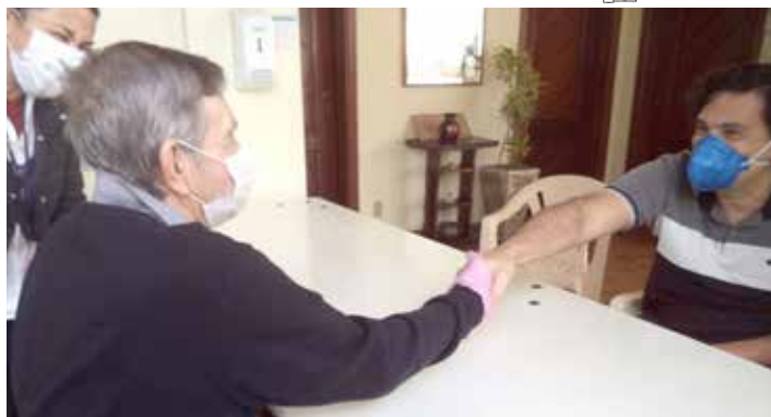
Visitas passam a ter apenas o distanciamento social em 2021