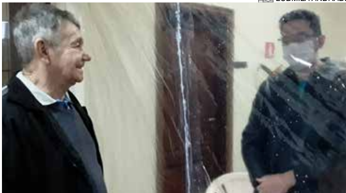
Retorno das visitas em 2020 com a cortina plastica